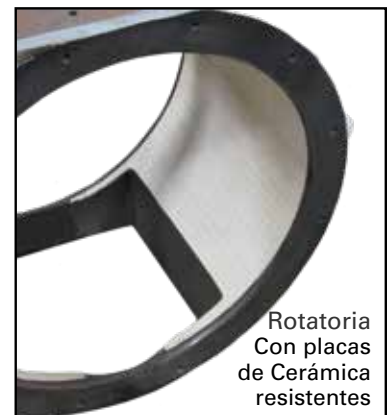
Rotatoria Con placas de Cerámica resistentes